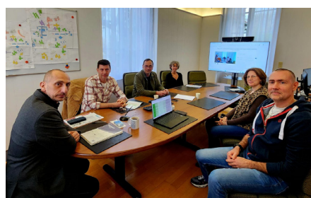
Rencontre avec la C.P.T.S.

Ces échanges ont permis de dresser un premier état des lieux du territoire,