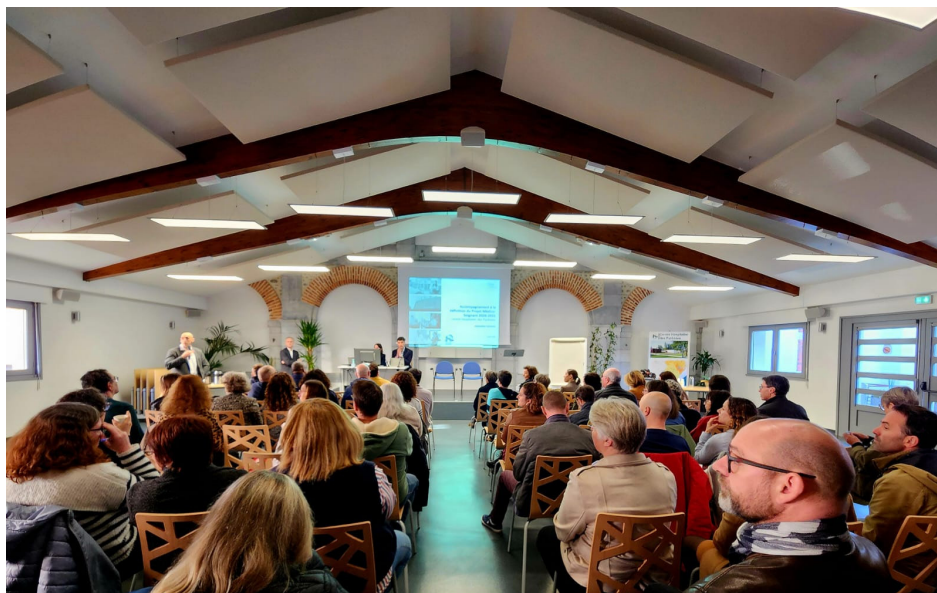
L'assemblée générale du 9 mars a réuni de nombreux professionnels de l'établissement, marquant une nouvelle étape dans cette démarche de co-construction.

Depuis le début de l'année, la co-construction de notre futur projet médico-soignant est engagée. Première brique du prochain projet d'établissement, il couvrira la période 2027/2031.