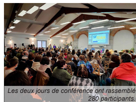
Les deux jours de conférence ont rassemblé 280 participants.