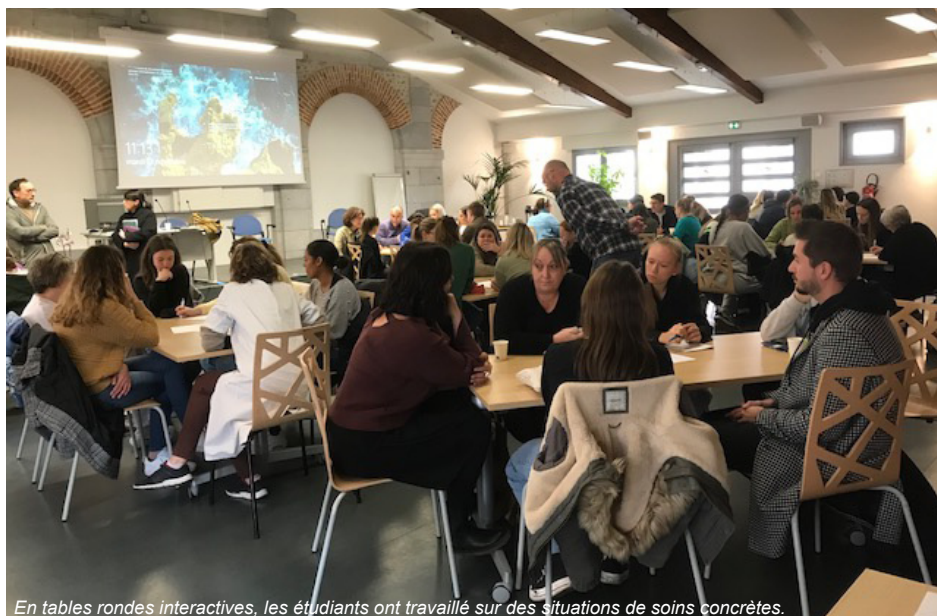
En tables rondes interactives, les étudiants ont travaillé sur des situations de soins concrètes.

Mardi 19 novembre dernier, le C.H. des Pyrénées a accueilli 60 personnes dont 46 étudiants et apprenants pour la 6 ème rencontre des stagiaires, un événement organisé par la direction des soins et articulé autour de la question : «Comment prendre soin ?».