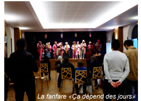
La fanfare «Ça dépend des jours»

Un grand merci également aux agents qui ont participé à l'organisation de cette journée et soutenu l'équipe de l'Espace Socio-Culturel dans sa mise en place.