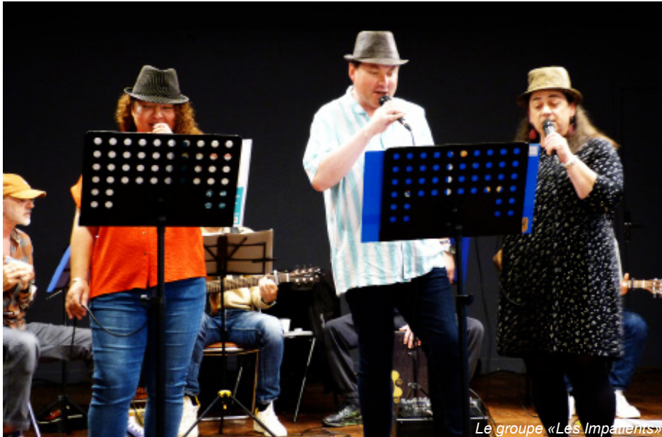
Le groupe «Les Impatients»

Cette édition bien que pluvieuse, nous contraignant à un repli en salle de théâtre, aura tout de même été réussie. En effet, malgré le temps capricieux, environ soixante-dix patients et agents étaient présents tout au long de la journée du 20 juin dernier pour soutenir les artistes, découvrir et s'amuser autour des différentes prestations musicales, partageant des moments de plaisir et de convivialité.