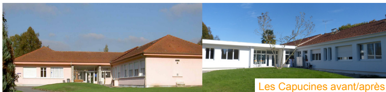
Les Capucines avant/après

Engagés depuis mai 2014, les travaux de rénovation de l'unité d'hospitalisation complète pour adolescents «Les Capucines» se sont achevés au mois d'octobre dernier.