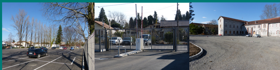
De gauche à droite : Parking Nord, situé à l'entrée du C.H.P., Parking Sud, le long de l'avenue des Lauriers et Parking Central dans la partie centrale suite à la démolition des Dalhias

Par ailleurs, le parking d'Esa 2 a été agrandi d'une vingtaine de places.