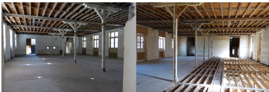
Étages Navarre & Ayous : la démolition de la distribution interne des bâtiments a permis de libérer des plateaux.