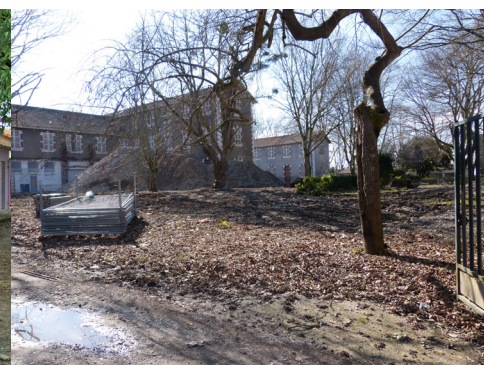
... et après.