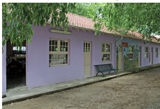
L'Espace Libre Accueil avant ...