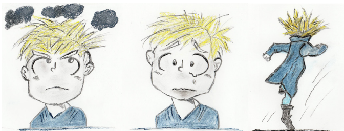
Illustrations © Patricia Le Guen