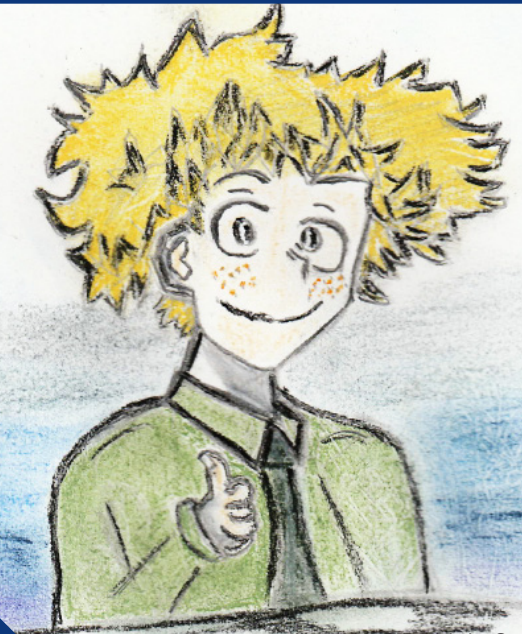
Illustration © Patricia Le Guen